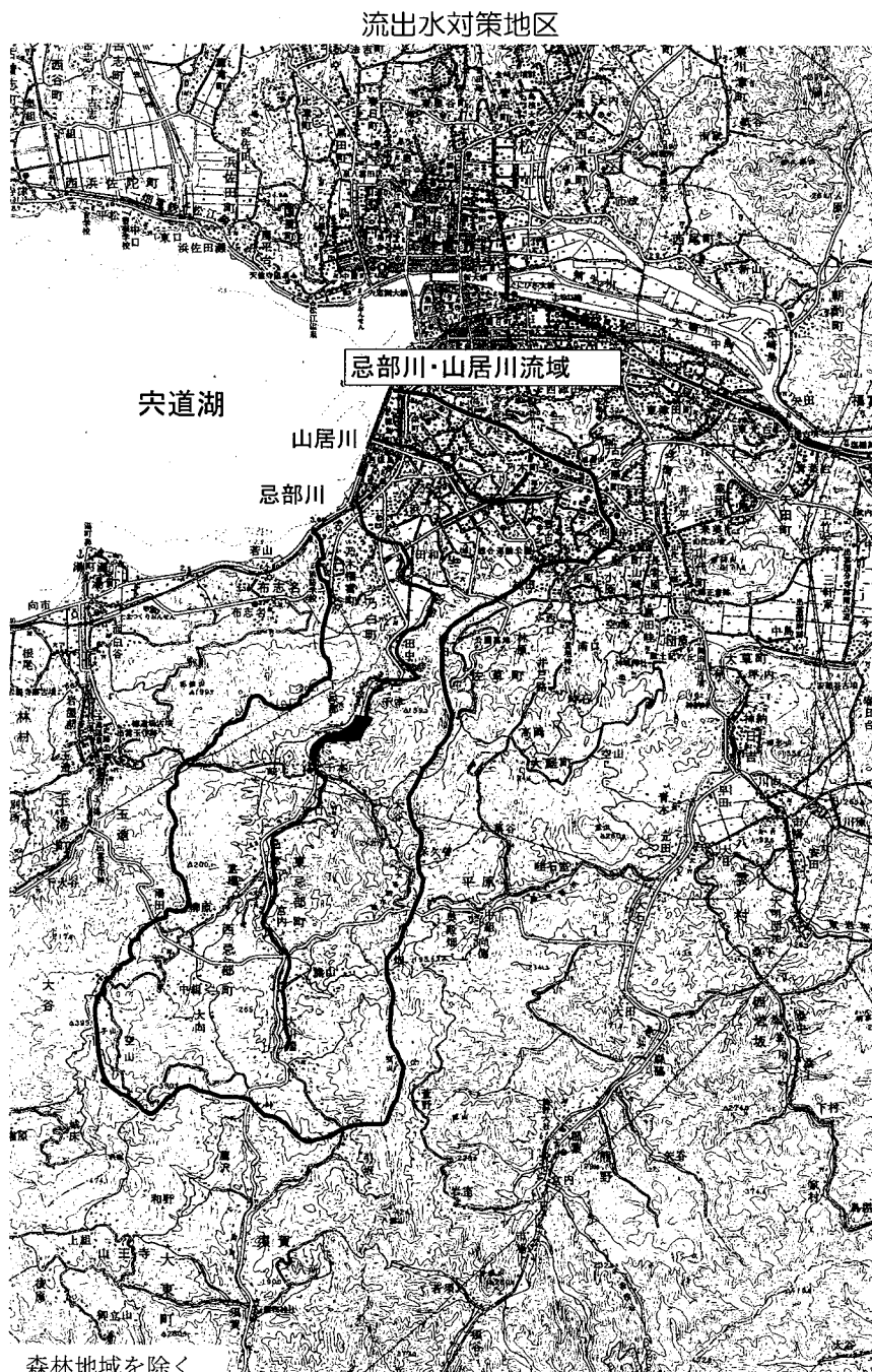
この地図は国土地理院発行の5万分の1地形図(松江)を使用したものである。

また、県及び市は、対策の促進と地域住民の負担軽減のため、地域住民の活動等に対して支援する。